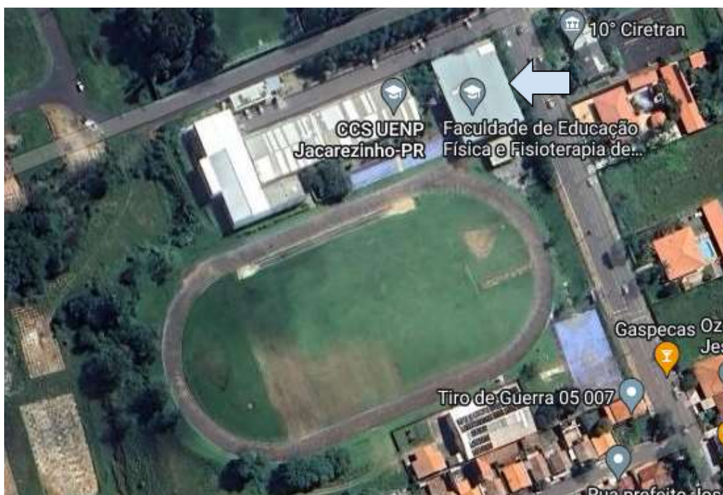
Figura 1: Centro de Ciências da Saúde/ CJ.