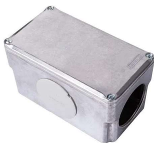
Figura 3 exemplo ilustrativo condutele alumínio

Nos pontos de utilização, instalar caixas para tomada de ligação futura dos equipamentos tipo sobrepor em caixa metálica