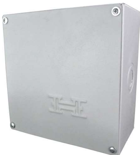
Figura 2 exemplo ilustrativo caixa de passagem elétrica metálica de sobrepor

Nos quadros, instalar os disjuntores tipo DIN para proteção dos circuitos, todo quadro terá seu disjuntor geral de proteção.